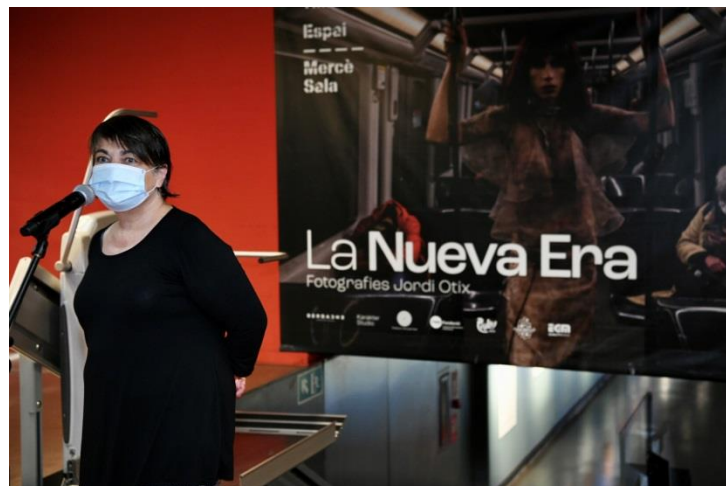
La presidenta de TMB, Rosa Alarcón, en l'acte d'inauguració de l'exposició 'La nueva era' a l'Espai Mercè Sala.

L'exposició es pot veure fins a finals de setembre a l'Espai Mercè Sala , situat al passadís de connexió entre els dos vestíbuls de la línia 5 de l'estació de Diagonal, de dilluns a divendres de 10 a 20 h. L'entrada és gratuïta.