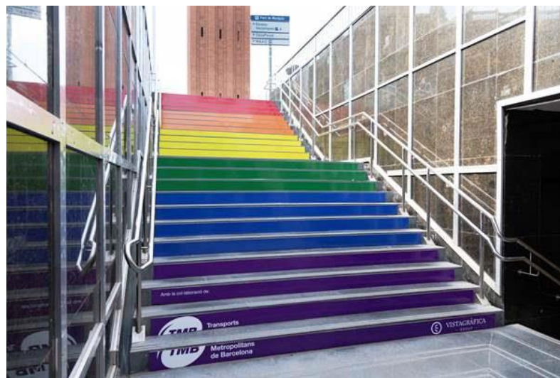
L'escala de la sortida Exposició de l'estació d'Espanya decorada amb la bandera multicolor.

Enguany, l'estació de metro d'Universitat va acollir el passat 25 de juny a la tarda una exhibició de dansa d'estil voguing i fins al 30 de juny es poden veure decorats amb els colors de la bandera LGTBI els graons de les escales d'accés de l'estació d'Espanya (L1 i L3) que donen a les Torres Venecianes de l'avinguda Maria Cristina.