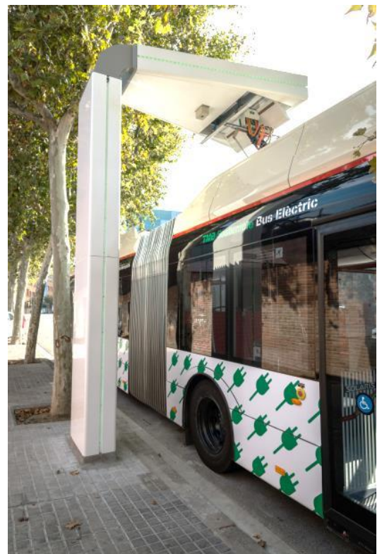
Autobús estacionat sota el carregador de vehicles pesants del carrer Cisell

D'altra banda, hi ha el que és pròpiament el pantògraf, un braç mecànic retràctil instal·lat al sostre de l'autobús que es desplega fins a unir-se a la campana del pilar, al qual s'acobla per iniciar la càrrega de la bateria mentre el vehicle està estacionat.