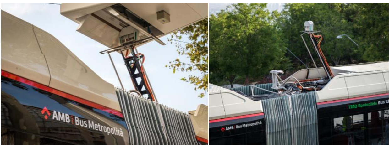
Detall del pantògraf acoblat a la campana del punt de càrrega ràpida A la dreta es pot veure la posició del braç retràctil sobre el sostre del Solaris Urbino 18E

Aquest sistema, també anomenat d'oportunitat, permet omplir fins al 80% de la bateria del vehicle —que sempre es manté per sobre del 40%— en un temps d'entre 5 i 8 minuts, gràcies als 400 kW de potència del carregador. El carregador, a més, està connectat al Centre de Control d'Endesa, des d'on es comparteixen les dades amb el Centre de Regulació d'Autobusos. Aquesta informació permet saber, en temps real, quina activitat està desenvolupant el dispositiu i l'estat del vehicle que s'hi ha connectat, una informació molt útil per l'operació de la flota de TMB.